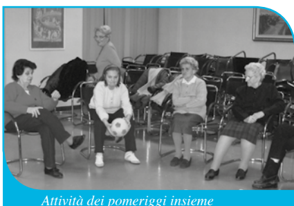
Attività dei pomeriggi insieme

di Alzheimer era pressoché sconosciuta sul territorio!) Un grande aiuto in tal senso è stato offerto da tanti musicisti locali e non che, con i loro concerti, hanno attirato moltissime persone. Anche l'apertura, nel maggio 1995, di un Centro Regionale Alzheimer presso l'I.D.R. di via Kennedy e la presentazione alla città è stata un'occasione propizia di sensibilizzazione. E poi... con grande entusiasmo ci si è