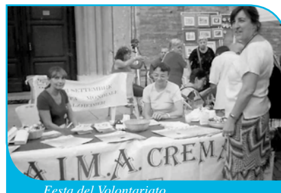
Festa del Volontariato

● Anche in ambito culturale l'Associazione ha offerto il suo contributo in occasione della presentazione alla stampa, a Milano, del 1° Vademecum Alzheimer nel 1996 (con l'intervento di Beppe Severgnini e Ottavia Piccolo) e della nuova edizione del 2011, nonché dei libri "Mi manchi" di Nadine Trintignant, "Più o meno qui, vicino al cuore" di Rosangela Percoco, e "Diario a quattro zampe" di Antonella Agnello. Ha presentato in città alcuni films sul tema della malattia: "Quel che resta di lei" di R. Rovescalli, e "Capitan Pistone e tutti gli altri" di M. Consoli.