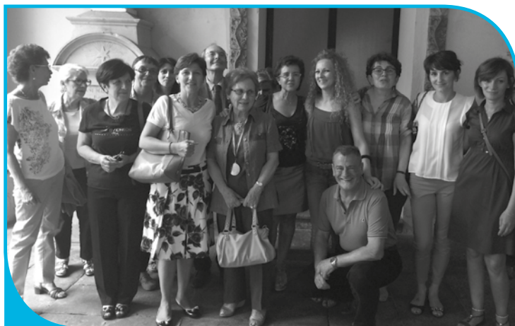
Premio "Un cuore in ogni quartiere" - 2015

L'Associazione riceve, inoltre, donazioni da privati che credono nella bontà dell'opera svolta. A tutti gli Enti e alle gentili persone che in vario modo l'hanno sostenuta, A.I.M.A. esprime il più sincero ringraziamento unitamente a sentimenti di profonda riconoscenza.