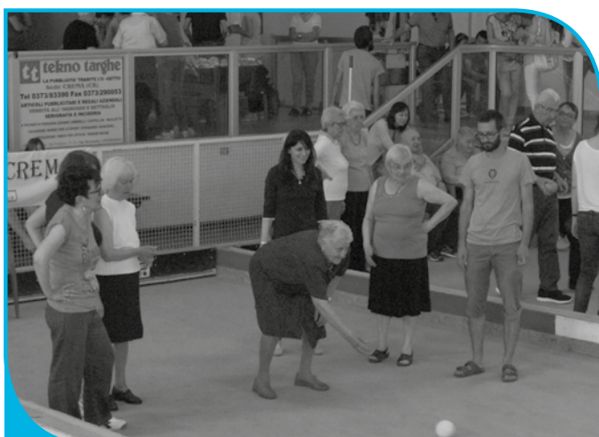
Gara di bocce - 2015