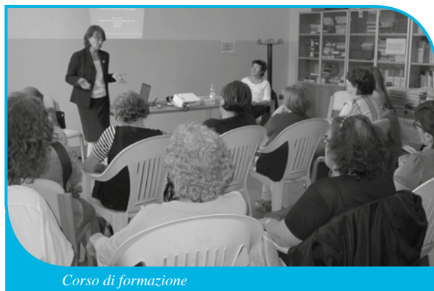
Corso di formazione

A Roma, al convegno ITINAD (Italian interdisciplinary Network