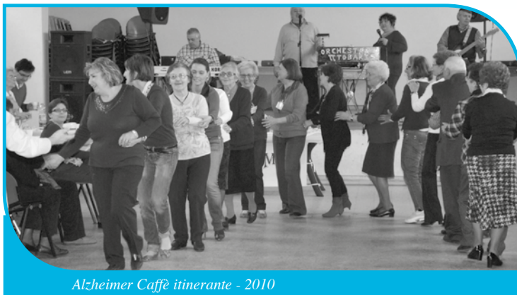
Alzheimer Caffè itinerante - 2010

La bontà e la valenza di tali interventi è stata confermata negli anni dalla restituzione che gli alunni incontrati hanno offerto all'Associazione con i loro disegni su qualche aspetto della malattia e, soprattutto, con le loro riflessioni e i loro scritti veramente appropriati, "sentiti", a volte persino commoventi. Ne è testimonianza tutto quanto è stato pubblicato sul semestrale "Promemoria", organo di informazione sulle attività svolte da A.I.M.A. CREMA che, a partire dal 2001, viene inviato a tutti i soci, ai medici del territorio, alle R.S.A. della provincia.