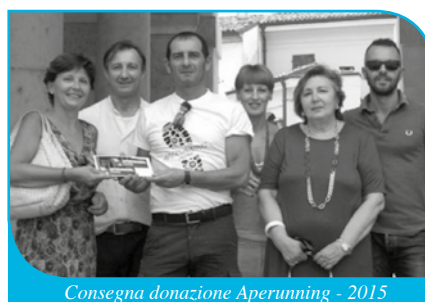
Consegna donazione Aperunning - 2015

Sponsor di A.I.M.A. fin dalla sua fondazione è l'ASSOCIAZIONE POPOLARE CREMA PER IL