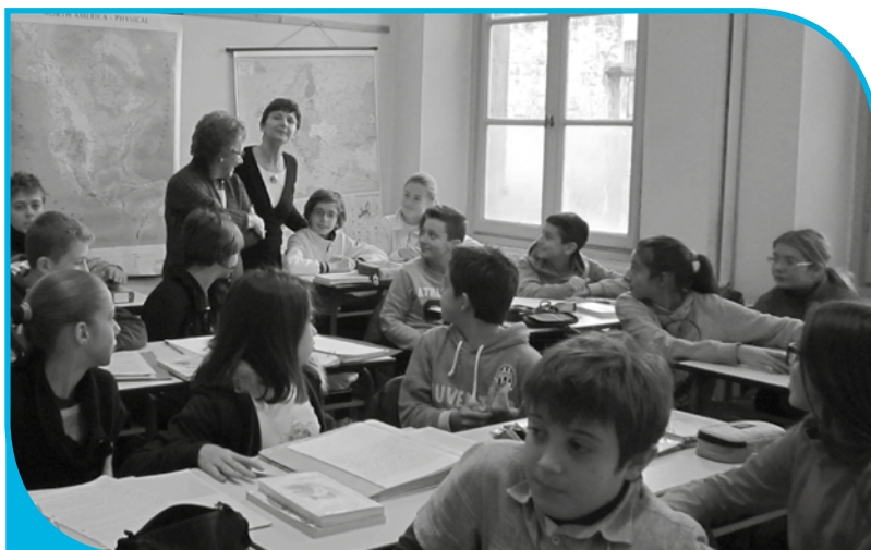
Scuola Media Vailati

● Un'attività caratterizzante l'A.I.M.A. di Crema, nella quale l'associazione crede molto e che svolge con convinzione è l'incontro dei volontari con gli alunni delle scuole del territorio: dalle primarie alle medie, alle superiori (istituti tecnici, licei, scuole professionali). Dal 1996 ad oggi è stata compiuta una costante opera di informazione e di sensibilizzazione con l'intento di favorire, presso le giovani generazioni, quel cambio culturale che permetta un approccio corretto verso la malattia e le persone che ne sono colpite, abbattendo la diffidenza, la vergogna, la solitudine...tabù che ancora circondano