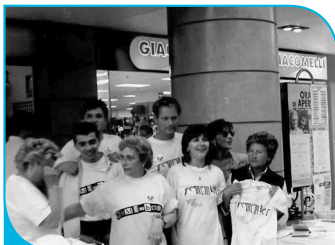
Banchetto informativo - 1999