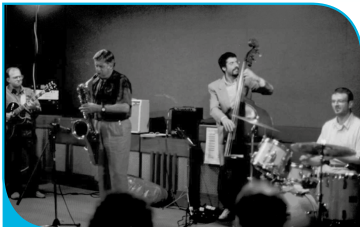
Giornata mondiale Alzheimer - 1995

on Alzheimer Disease) AIMA ha ottenuto un importante riconoscimento.