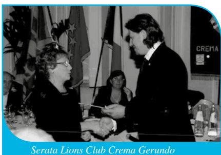
Serata Lions Club Crema Gerundo

organizzate dai Clubs di servizio della città (Lions, Rotary, Inner Wheel, Circolo del Ridotto, Rotaract; Round Table): 4 sfilate di alta moda, 2 gare di golf, feste di carnevale, un "gran galà della solidarietà" (con la collaborazione di ben 7 clubs).